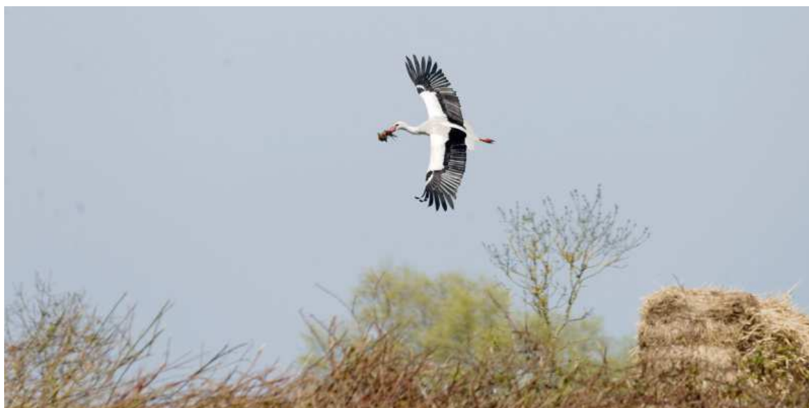
Apport de matériaux pour la construction du nid.

Le printemps très humide n'a finalement pas eu de grosses conséquences dans la reproduction des cigognes en Loire-Atlantique. On constate seulement qu'il n'y a pas eu d'évolution entre 2012 et 2013 dans les effectifs nicheurs et le nombre de poussins. L'effort de baguage s'est accentué en 2013 dans le cadre du programme déposé pour le compte du groupe Cigognes-France.