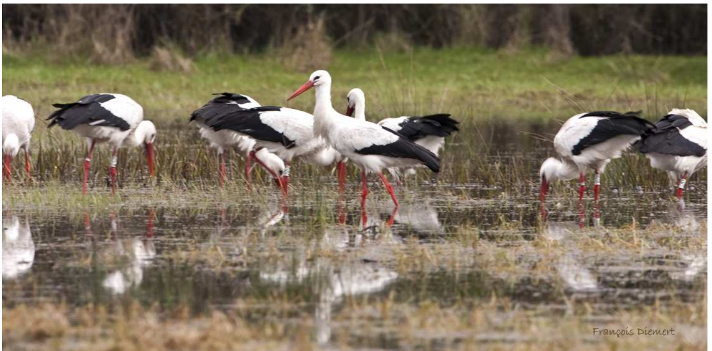
Janvier 2013, un groupe de cigognes fréquente régulièrement une prairie humide en plein bourg de Vue.

Certains cigognes faisaient des allers-retours entre ces sites et la décharge de Grand'Landes en Nord Vendée.